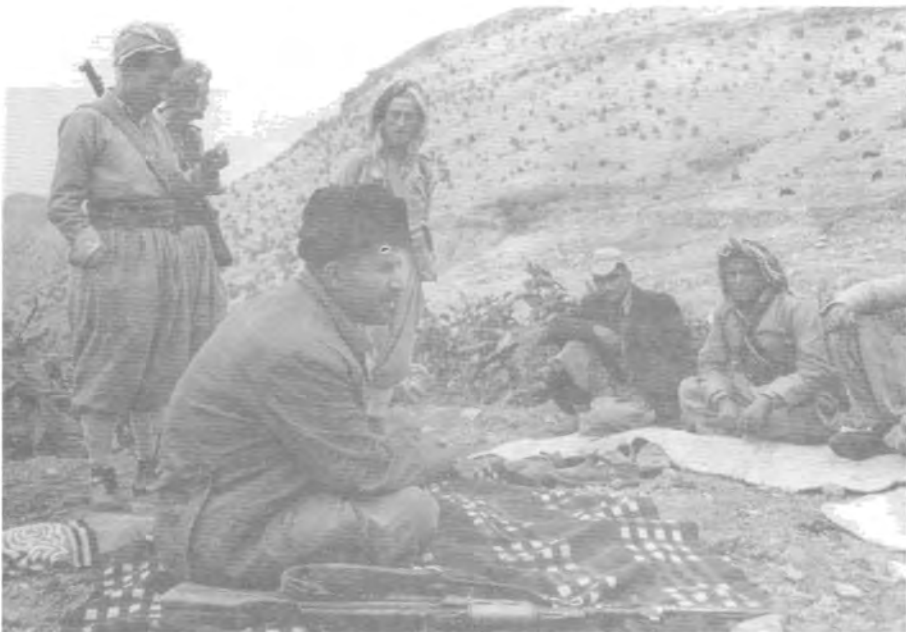
له‌گه‌ن کۆمه‌نیک پیشمه‌رگه، ۱۹۶۳